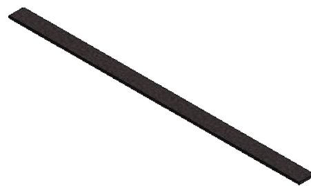
( 1 : 10 )

Diese Zeichnung / Skizze ist Eigentum der wedi GmbH und unterliegt dem Urheberrecht. Die Verwendung bedarf in jedem Fall der vorherigen, schriftlichen Zustimmung der wedi GmbH.